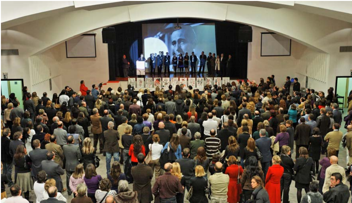
Acto de presentación del libro "Crímenes de Castellón" en el Casino Puerto Azahar. (Castellón, 15/12/2008)